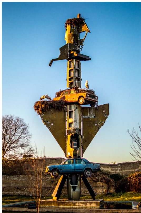
Wolf Vostell, ¿Por qué el proceso entre Jesús y Pilatos duró solamente dos minutos? 1996

Como ejemplo de esta idea podemos ver la obra de Wolf Vostell: ¿Por qué el proceso entre Jesús y Pilatos duró solamente dos minutos? (1996).