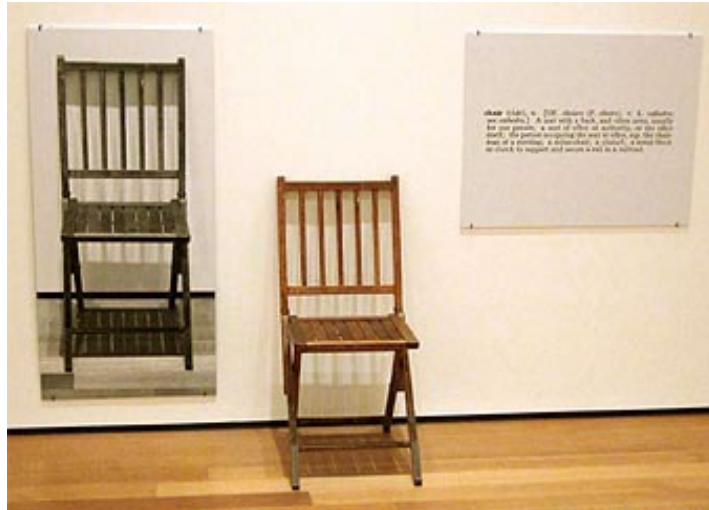
Una y tres sillas, 1965, Joseph Kosuth

Será en los años 50 cuando empieza el arte conceptual, otra vuelta de tuerca, muy influenciado por la filosofía analítica 4 e interferido por la obra de L. Wittgenstein. De estos postulados tendremos, tal vez, la obra más icónica de Joseph Kosuth: Una y tres sillas (1965).