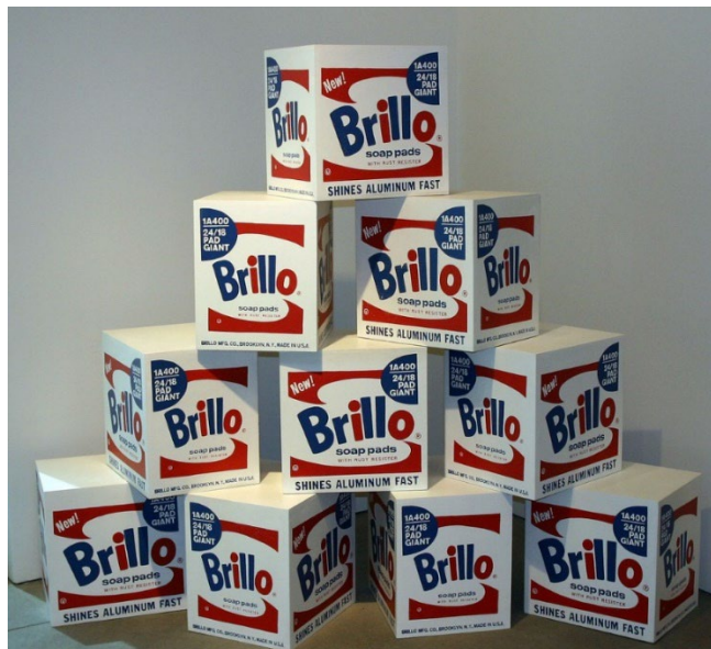
Andy Warhol. Cajas de Brillo (1964), las cajas son una copia exacta de las cajas originales, solo cambia el tamaño, las de warhol son algo mayores en tamaño y están realizadas con serigrafías por warhol.

Y llegamos a Warhol, donde refunde todo. Ahora son objetos directamente de la cultura popular los que se convierten en sujetos de una obra de arte; ya no hay diferencia entre lo real y artístico.