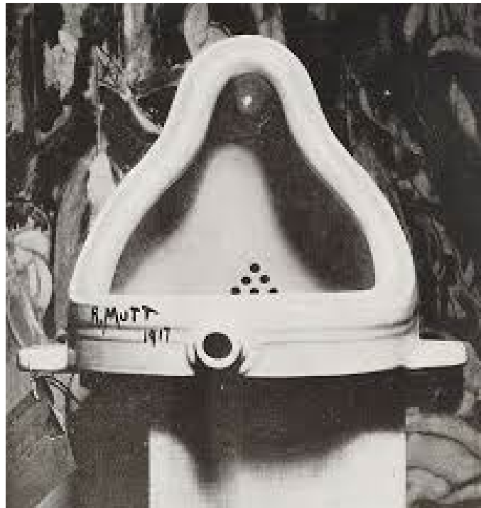
Marcel Duchamp, La Fuente 1917. Firmando con seudónimo R. Mutt. Foto de, Alfred Stieglitz, a la izquierda puede observarse el cartón con la inscripción a la exposición.

La obra fue rechazada, pero un galerista reconocido, Alfred Stieglitz, la documentó y la reconoció como obra de arte. En la propia foto, a la izquierda puede verse el papel de la inscripción en la exposición; esta es la única documentación que tenemos de La fuente .